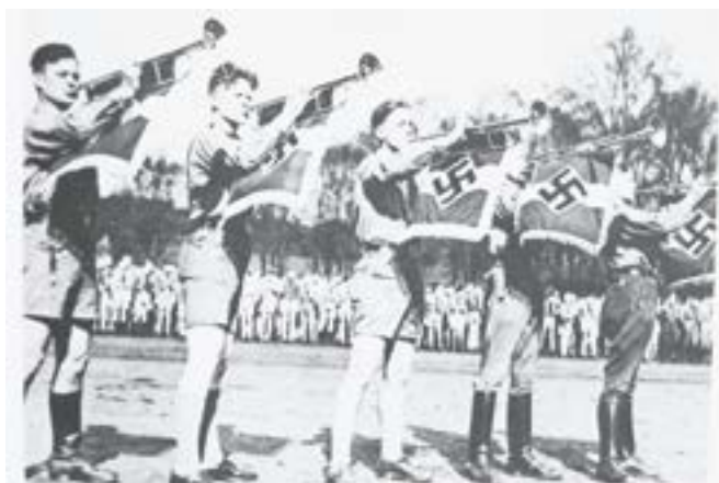
Enfants des Hitlerjugend lors d'une cérémonie en Allemagne

Malheureusement, les deux premiers sabotages font trop peu de dégâts pour stopper efficacement le trafic. Paul Delecluse et ses camarades cheminots savent que le sabotage d'un aiguillage est plus efficace. Un membre du groupe se trouvant en service au poste d'aiguillage le soir du samedi 1er avril, un nouveau sabotage est décidé. La charge est placée sur l'aiguillage près de la rue principale d'Ascq et vise un train de marchandises allemand.