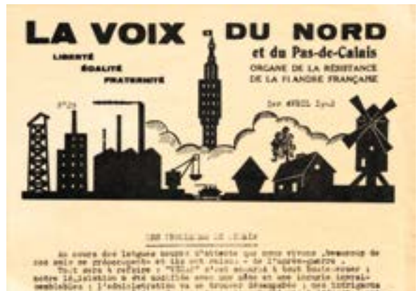
La Voix du Nord clandestine du 1er avril 1942

L'armée d'Occupation pourchasse les résistants. Mais à partir de 1942, c'est la Gestapo qui intervient. Le préfet du Nord, aux ordres du régime de Vichy, met sa police au service de l'Occupant. Des agents doubles infiltrèrent les réseaux de résistance. La répression est féroce. Les résistants arrêtés sont cruellement torturés. Après des jugements expéditifs, ils sont exécutés dans les forts qui entourent Lille (Bondues, Seclin,...). L'Occupant utilise la menace et la terreur en placardant dans les localités des « Avis d'exécution ».