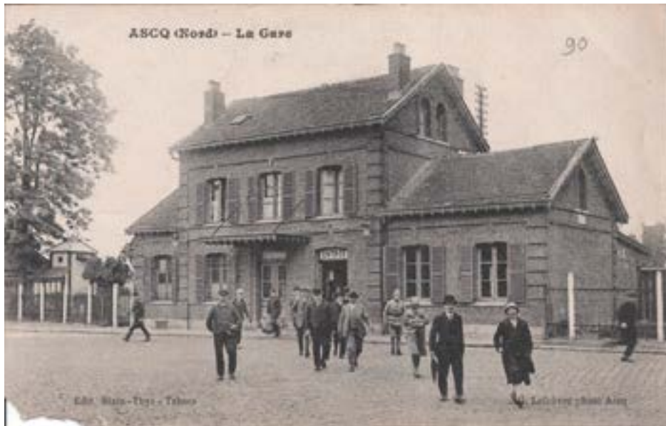
La gare d'Ascq

Les Ascquois sont réveillés par l'explosion et sont alertés par le tapage des coups frappés par les SS. Des portes sont enfoncées pour rechercher les hommes.