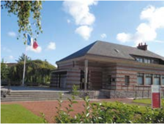
Le Mémorial Ascq 1944

Le docteur Mocq, installé à Ascq, publie en 1971 un récit des événements : Ascq 1944, la nuit la plus longue. Il crée, avec la collaboration de Gérard Chrétien, un fils de massacré, le Musée du Souvenir des victimes d'Ascq. Il est inauguré en 1984 par le Premier Ministre Pierre Mauroy.