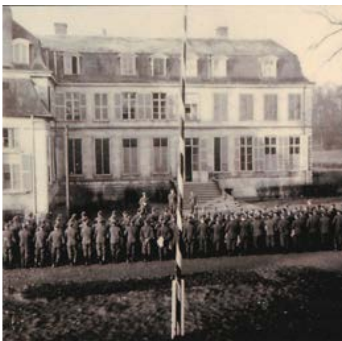
Soldats allemands dans la cour du château de Brigode à Annapes

Des habitants les aident en leur apportant de l'eau et de la nourriture. Certains vont plus loin en cachant des prisonniers qui s'échappent de la colonne : c'est le début de la résistance de solidarité. L'abbé Wech de la paroisse d'Ascq aide les soldats prisonniers à s'évader en fabriquant de faux papiers.