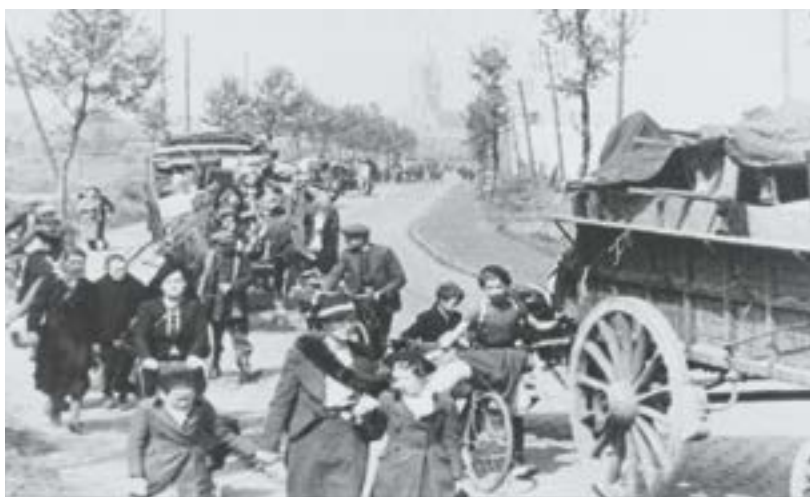
Civils en exode fuyant Bailleul

Le Nord-Pas-de-Calais, dans la zone occupée, est rattaché au commandement militaire allemand de Bruxelles. C'est l'Oberfeldkommandantur 670, installée dans la nouvelle bourse de Lille (actuelle Chambre de Commerce), qui régente militairement la région. Ascq dépend de la Kommandantur de Roubaix.