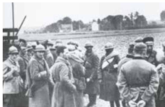
Colonne de soldats français prisonniers après la défaite de juin 1940

Hitler loge au Château du comte de Montalembert à Annapes le 1 er juin 1940. Pendant ce temps, des milliers de prisonniers de guerre français et britanniques passent à pied sur la route nationale Lille-Tournai (actuelle rue des Fusillés à Ascq) en direction de l'Allemagne.