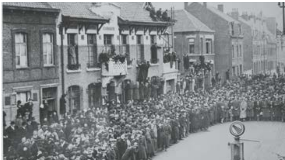
Foule amassée devant la mairie d'Ascq sur le parcours du cortège transportant les cercueils des victimes le 5 avril 1944