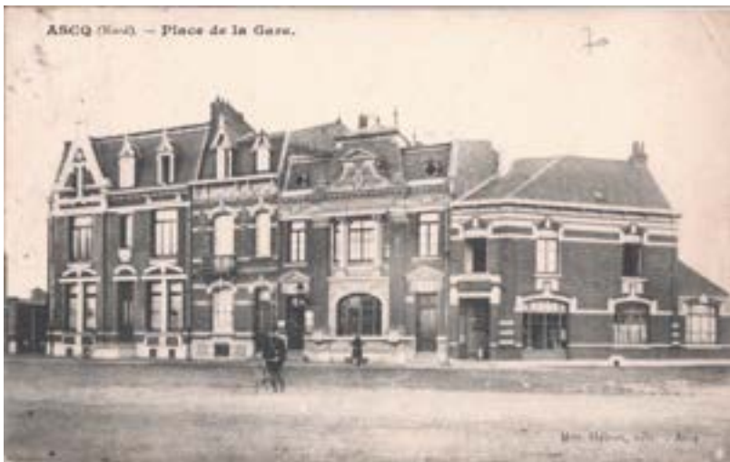
Place de la gare. Au centre la poste d'Ascq.