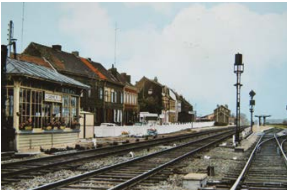
Photo de la voie ferrée à Ascq. Au premier plan à gauche la cabine d'aiguillage. Au fond à gauche la gare d'Ascq

Le 27 mars 1944, le groupe d'Ascq effectue un premier sabotage de la voie ferrée Lille-Bruxelles près d'Ascq. Le 30 mars, l'officier responsable des parachutages de la région Nord, le capitaine Jean-Pierre, vient faire une démonstration de l'utilisation des explosifs pour les résistants du groupe sur la portion de la voie ferrée entre Ascq et Tressin. L'objectif est de stopper les trains de marchandises allemands le plus longtemps possible afin de favoriser le débarquement des Alliés en Normandie. Par ces sabotages, ils cherchent également à diminuer le nombre de bombardements alliés sur les gares de triage de Fives et de Lomme qui occasionnent des centaines de victimes civiles.