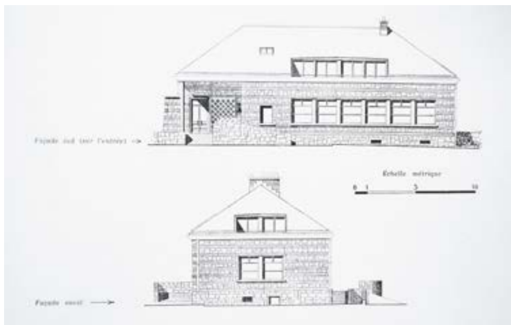
Plans du dispensaire établis par les architectes Luc et Xavier Arsène-Henri

Pour perpétuer le souvenir des massacrés, les Ascquois élèvent un ensemble monumental sur les lieux du drame. Les veuves souhaitent faire passer ici un message de paix : un dispensaire servant à la protection de la vie s'élèvera là où leurs maris et leurs fils ont été exécutés.