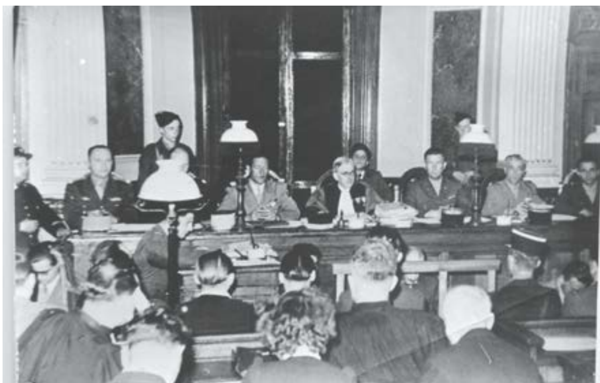
Tribunal militaire à Lille, août 1949

De novembre 1945 à octobre 1946, 24 dirigeants nazis sont jugés lors du procès de Nuremberg. Certains membres de la 12 ème division SS Hitlerjugend sont retrouvés dans des camps de prisonniers de guerre. Leur jugement est possible en raison de leur appartenance à la SS, une organisation déclarée criminelle par le tribunal de Nuremberg.