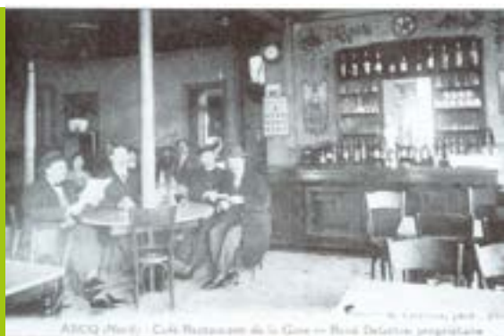
Café restaurant de la gare en 1938

Pendant la Seconde Guerre mondiale, Ascq est un bourg rural de la grande banlieue lilloise qui compte 3500 habitants. À côté des fermes toujours nombreuses se sont développées de petites industries.