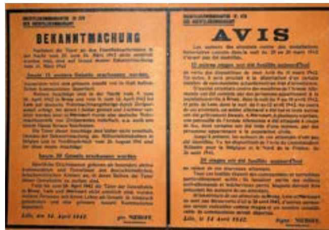
Avis de représailles du général Allemand Niemhoff placardé dans les rues suite au sabotage de voies ferrées par des résistants en 1942