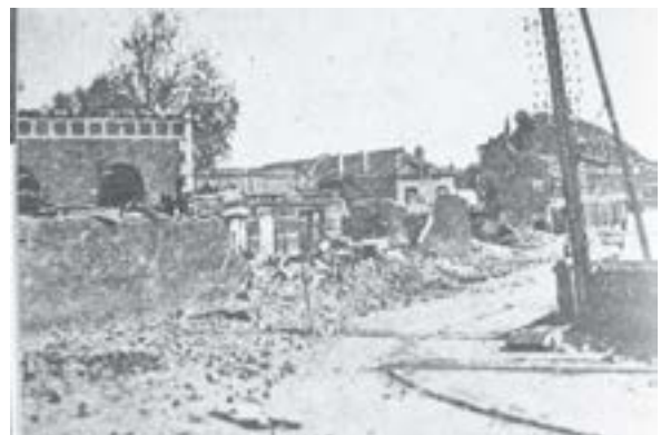
Dégâts à Fives suite aux bombardements alliés

Par refus de la défaite et de l'Occupation, la résistance s'organise. Des tracts et des journaux clandestins combattent la propagande ennemie et appellent à la résistance. Les renseignements fournis par les réseaux (Alliance, OCM) permettent aux Britanniques de continuer le combat efficacement. Ils bombardent les usines de Fives qui fournissent du matériel aux Allemands.