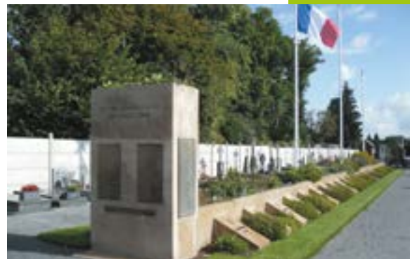
Le carré des massacrés dans le cimetière d'Ascq