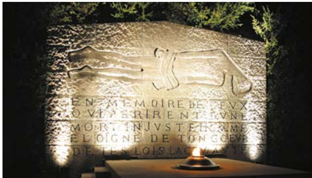
La stèle commémorative