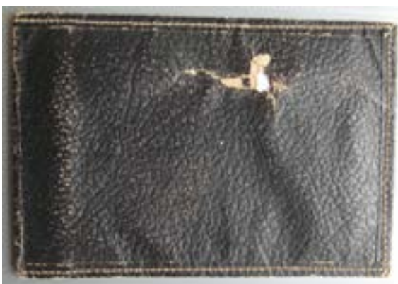
Portefeuille de Clovis Couque avec un impact de balle, coll. Mémorial Ascq 1944

Un second puis un troisième groupe sont emmenés le long de la voie et sont exécutés à coups de mitraillettes. Des sous-officiers achèvent d'un coup de revolver les mourants qui gisent à terre. Quelques hommes pourtant réchappent au massacre. Certains essaient de s'enfuir à la faveur de l'obscurité. Mais le sous-officier Stun ordonne à deux SS d'abattre les fuyards à revers depuis une maison isolée où habitent M. et Mme Roseau.