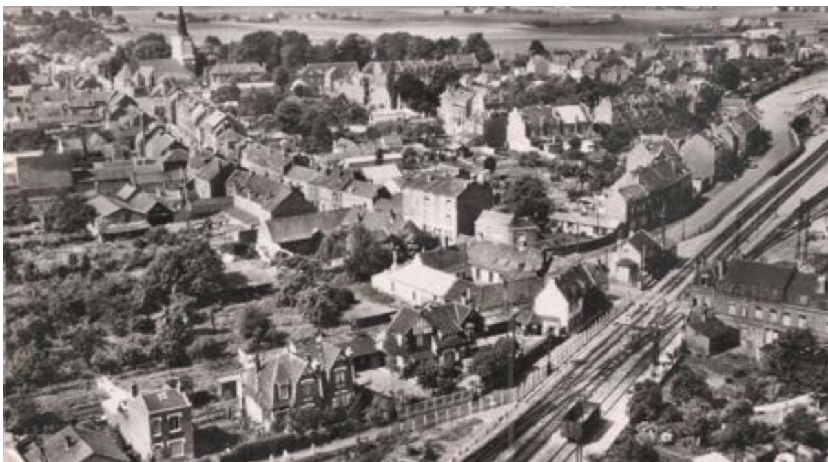
Vue aérienne d'Ascq