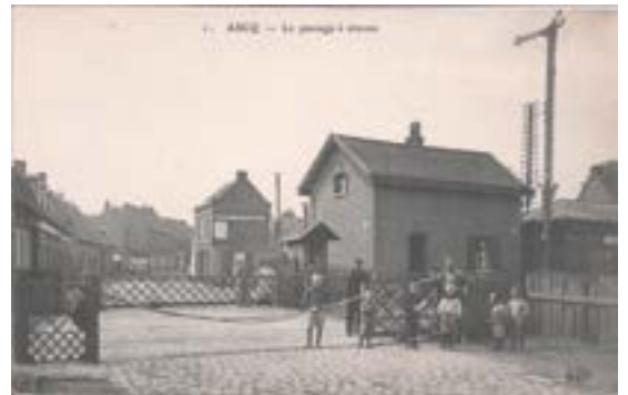
Passage à niveau de la rue Marceau (actuelle rue Gaston Baratte)

Le convoi allemand arrive à Ascq à 22h44 à petite vitesse. Une explosion se produit au passage de la locomotive. La machine s'immobilise face à la cabine d'aiguillage près du passage à niveau de la rue principale du village (actuelle rue Gaston Baratte). Trois wagons chargés de véhicules légers sont sortis des rails. Les dégâts sont minimes, mais le convoi est bloqué.