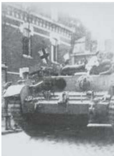
Char anglais libérant Ascq le 3 septembre 1944

Le 5 avril, une foule énorme d'environ 20 000 personnes témoigne sa sympathie aux victimes, aux 75 veuves et aux 127 orphelins lors des funérailles. Des dizaines de milliers d'arrêts de travail ont lieu dans les entreprises de l'arrondissement de Lille, sans aucune répression.