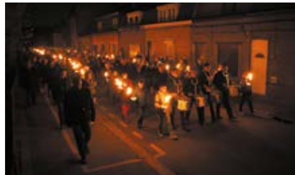
Retraite au flambeau dans les rues d'Ascq lors des cérémonies de 2014

Le lendemain une cérémonie officielle est organisée. Les représentants de la République témoignent de la reconnaissance de la Nation par leur présence à la messe de souvenir, puis au Tertre. Les Villeneuvois s'emploient à pérenniser le message pour la démocratie et pour la paix. Les manifestations du 75ème anniversaire s'inscrivent dans cette volonté commune