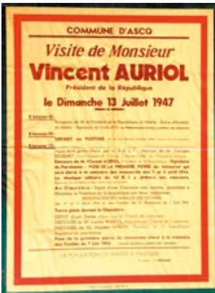
Affiche annonçant la visite du président de la République Vincent Auriol à Ascq en 1947

Après-guerre, Ascq est un symbole de la barbarie nazie pour les populations du Nord-Pas-de-Calais. La solidarité envers les 75 veuves et les 127 orphelins s'organise. Grâce à différentes associations, un « comité de secours aux familles des fusillés d'Ascq » se met en place. Les dons affluent de partout. Une somme considérable est donnée par les Français Musulmans d'Algérie. Elle parviendra à Ascq après la Libération.