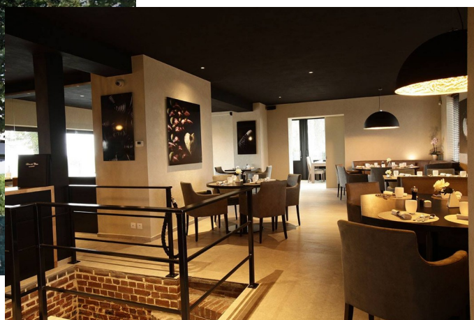
Le restaurant « L'Arbre » en 2021