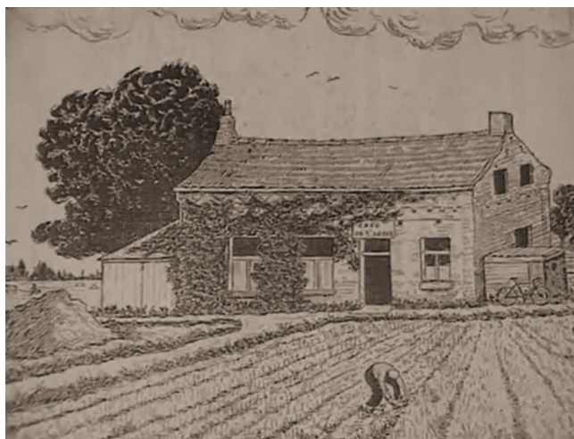
Dessin du café de l'Arbre