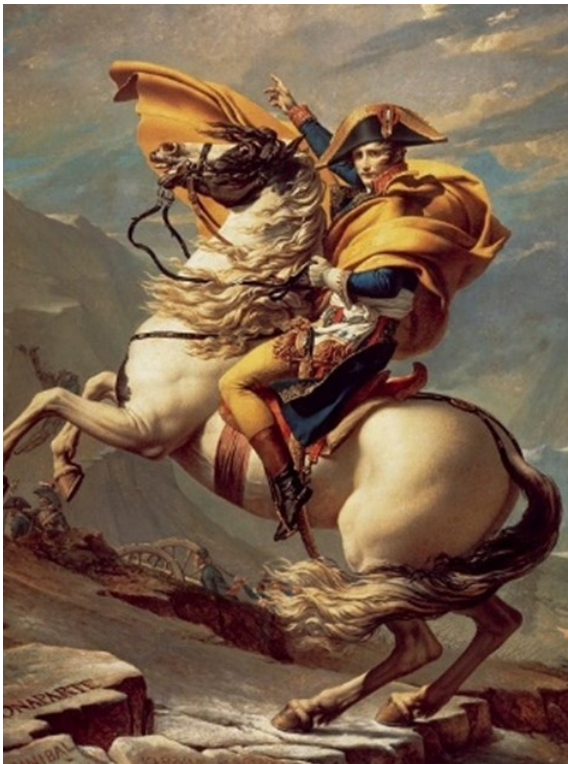
Figure 6 : Bonaparte franchissant le Grand Saint-Bernard Jacques-Louis David, 1801, huile sur toile, Musée national du château de Malmaison