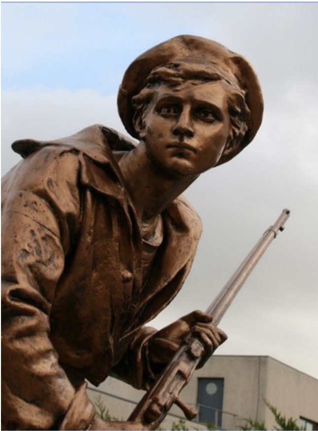
Figure 10 : Monument aux morts de Nérac (Lot-et-Garonne)