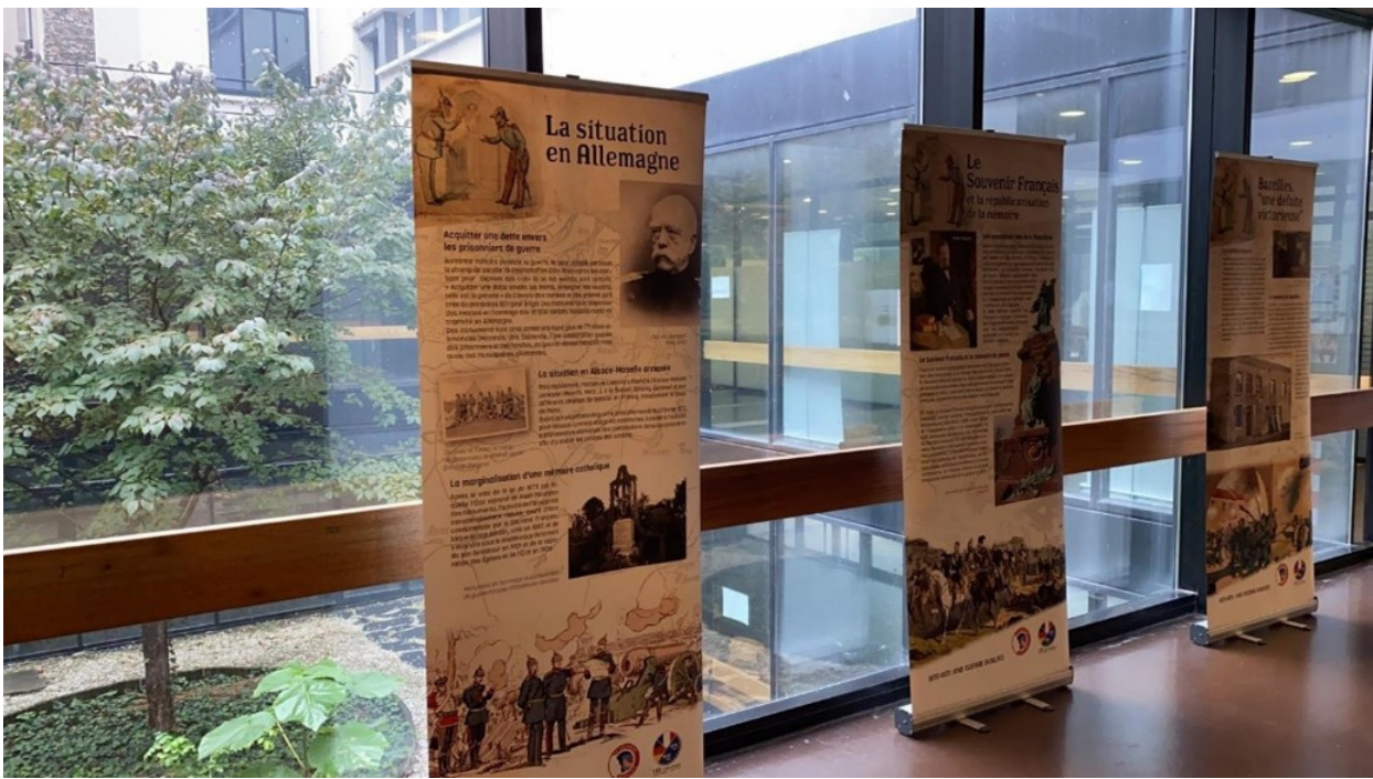
Figure 3 : L'exposition installée au lycée Jean Lurçat (Paris 13ème)