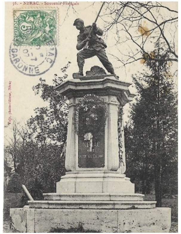
Figure 9 : Monument aux morts de Berck (Pas-de-Calais)