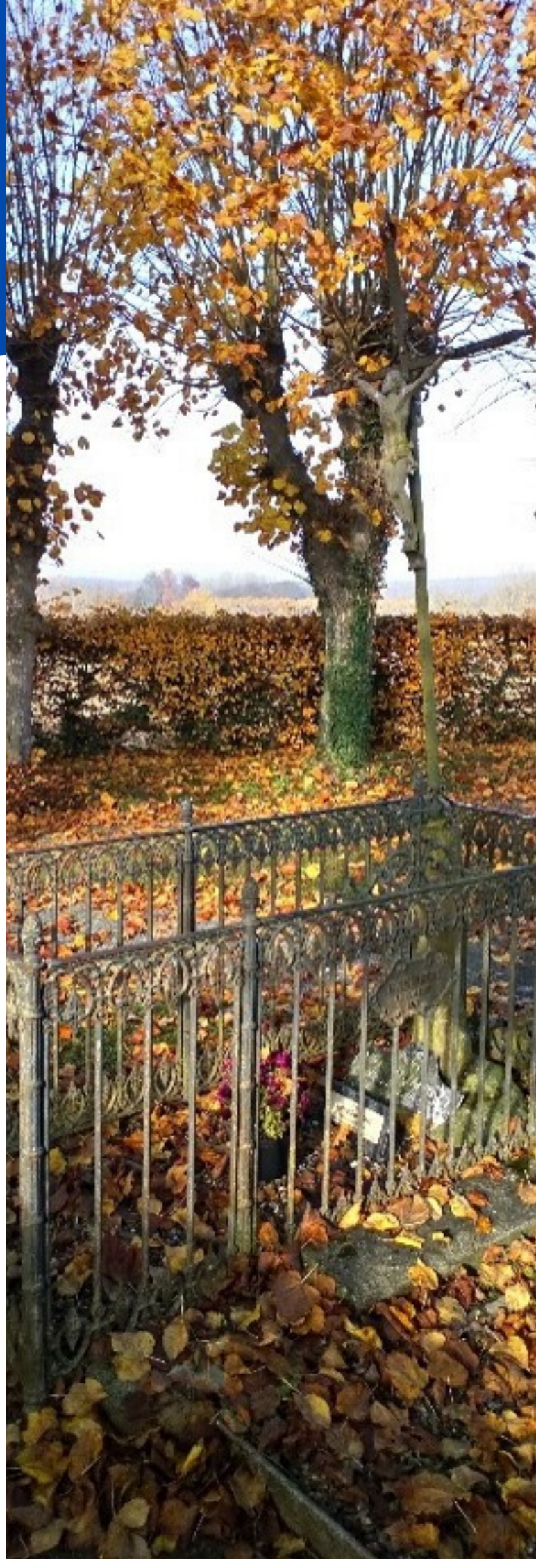
Figure 4 : Tombe dite du 4 avril 1873 à Bavelincourt (Somme)

Des ressources pour le français sont présentées en bibliographie en parallèle de propositions d'exercices pédagogiques en histoire des arts.