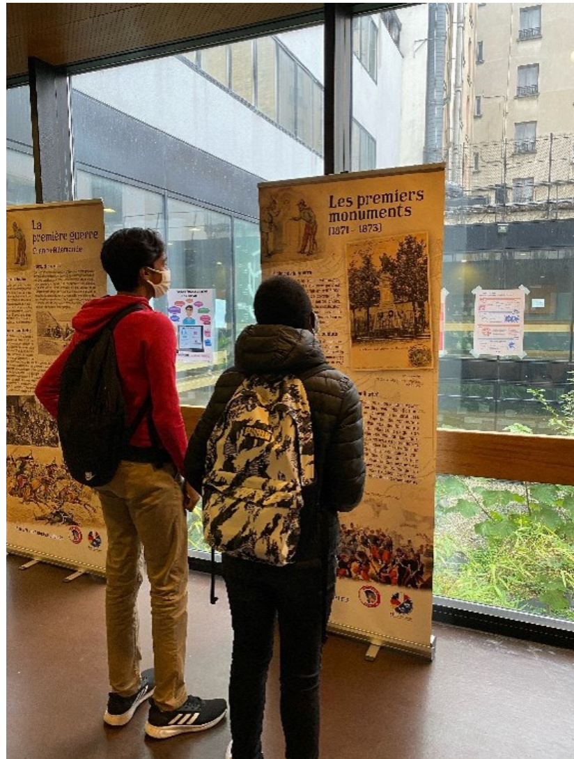
Figure 2 : l'exposition installée au lycée Jean Lurçat (Paris 13ème)

Le Souvenir Français est une association créée en 1887 autour de la mémoire de la guerre de 1870. Dans le cadre du 150ème anniversaire, nous proposons à tous les établissements qui le souhaitent une exposition sur ce conflit. Elle se compose de dix panneaux généraux et dans certains départements de deux panneaux supplémentaires évoquant la mémoire locale de la guerre.