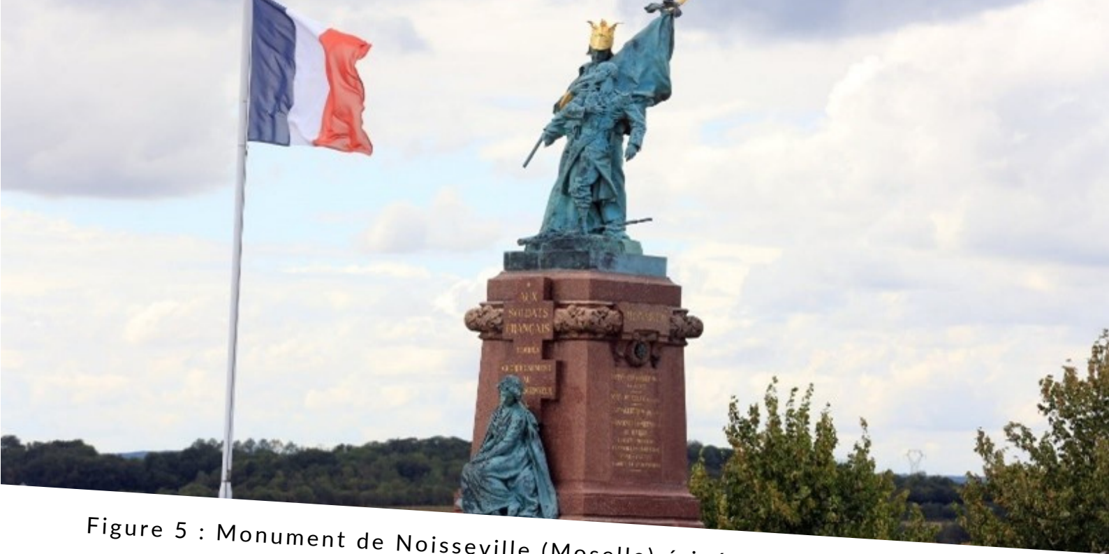
Figure 5 : Monument de Noisseville (Moselle) érigé par le Souvenir Français en 1908