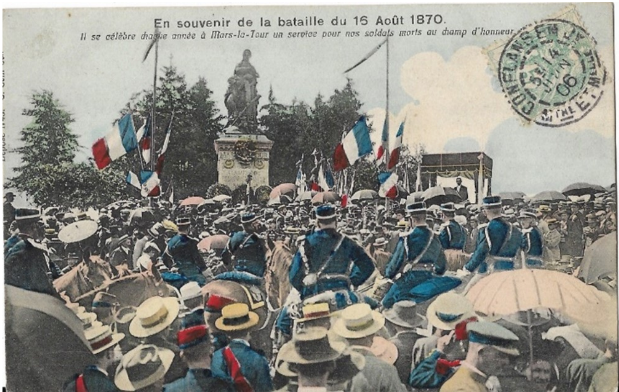
Figure 13 : Carte postale, 1906