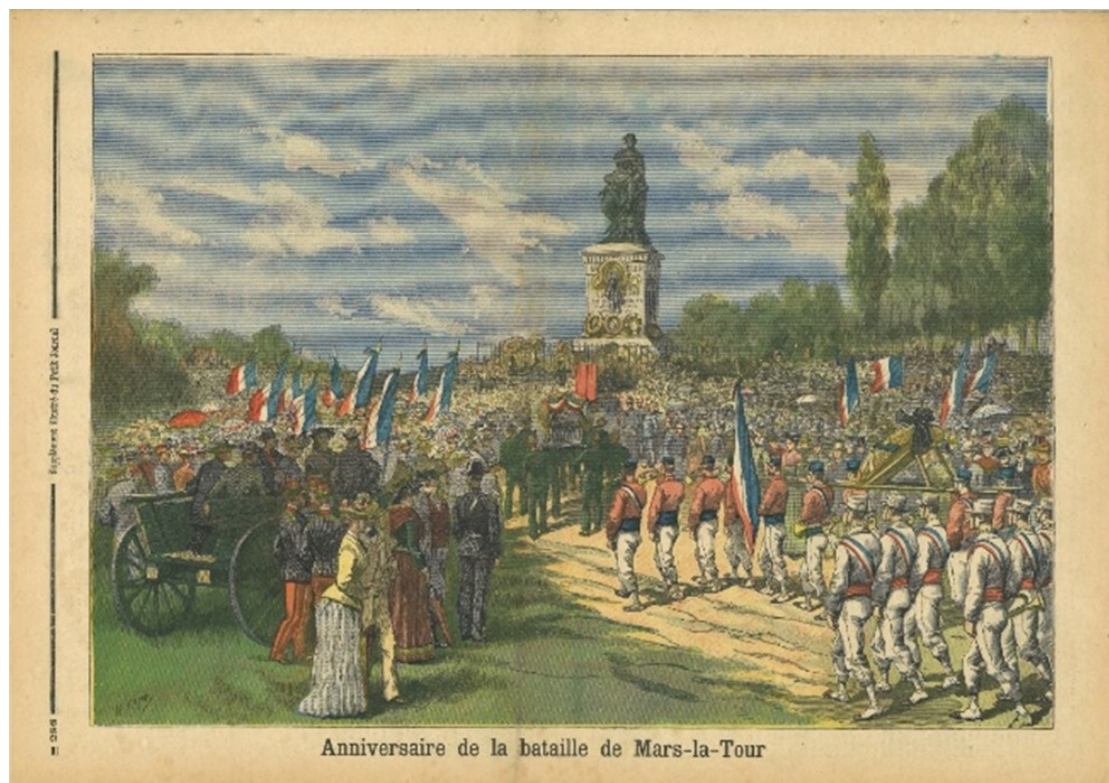
Figure 12 : Gravure parue dans le Supplément du Petit Journal, 1892