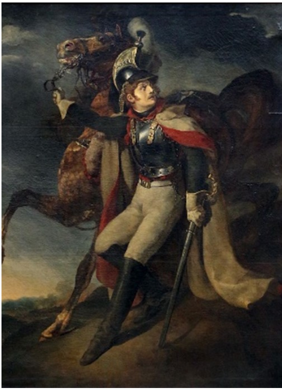
Figure 8 : Cuirassier blessé quittant le feu Théodore Géricault, 1814, huile sur toile, Musée du Louvre