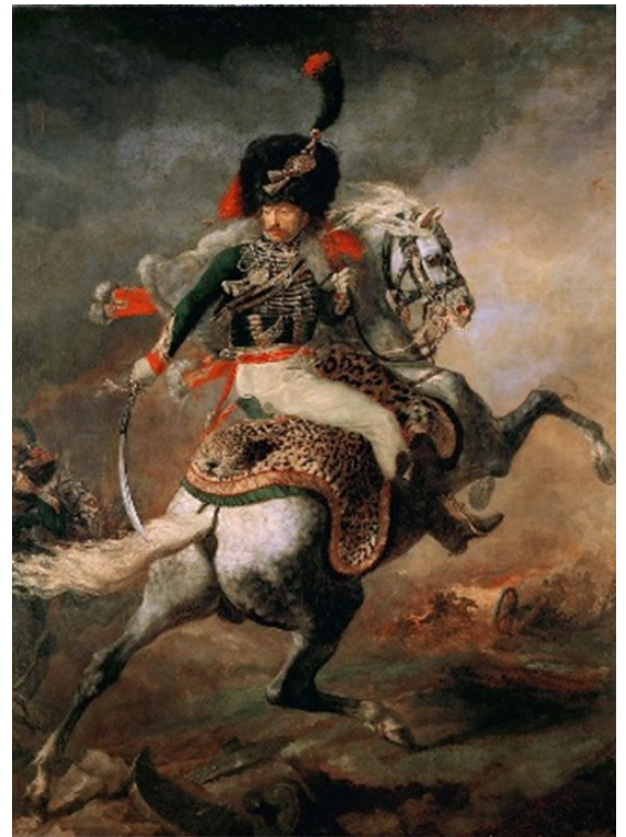
Figure 7 : Officier de chasseurs à cheval de la garde impériale chargeant Théodore Géricault, 1812, huile sur toile, Musée du Louvre