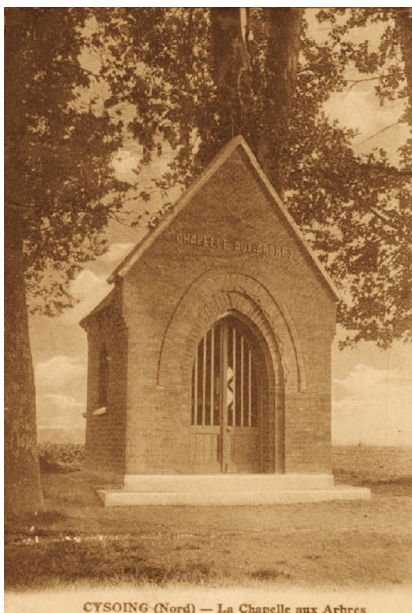
CYSOING (Nord) — La Chapelle aux Arbres