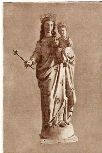
CYSOING. — Statue historique de Notre-Dame de Bonne Fin vénérée dans la Chapelle aux Arbres