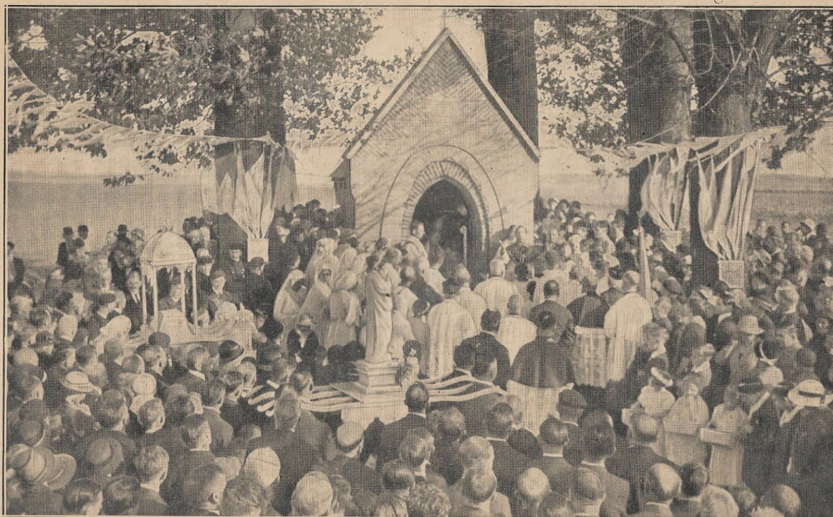
LA CEREMONIE DEVANT LA CHAPELLE AUX ARBRES

En 1997, lors d'une nuit au mois d'août, la chapelle fut profanée et la statue brisée, jetant la consternation dans tout le village. C'est à cette occasion que fut remarquée une anomalie : la statue exposée (et dorénavant détruite) n'était plus celle de Notre-Dame de Bonne-Fin mais une statue en plâtre représentant Notre-Dame de Lourdes. Une nouvelle statue en résine fut alors installée sur l'autel.