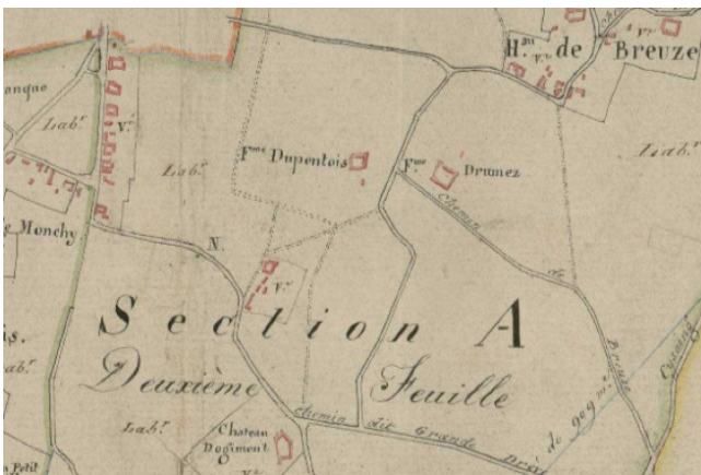
Cadastré de 1825