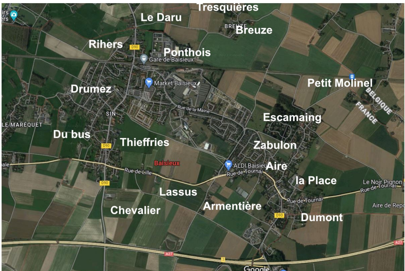
Les fiefs sur vue aérienne Google

Tenant-fief, Celui qui possède la jouissance d'un fief.