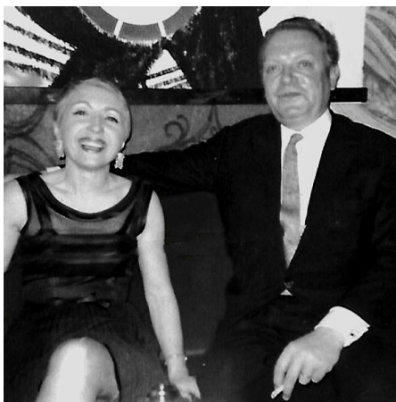
Figure marquante et incontournable de la commune, elle y a consacré sa vie à travers un double engagement exceptionnel : quarante années au service de la municipalité et un courage exemplaire au sein de la Résistance locale durant la Seconde Guerre mondiale.