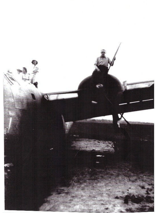
Plaine de Willems - Boisieux - Blandain - le 27 septembre 1944 500 - avion américain - Camille Pyr - Thérèse et Aline Hermant